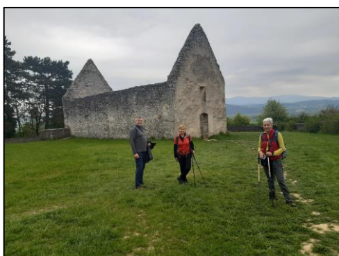
Zvyšky románskeho kostolíka